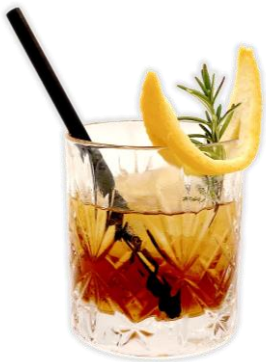
empanada y drink