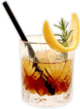
papas y drink